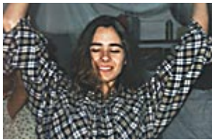
Dançando com Panos

Já os móveis e vitrais trazem a relação entre equilíbrio, estratégia e o mundo das idéias.