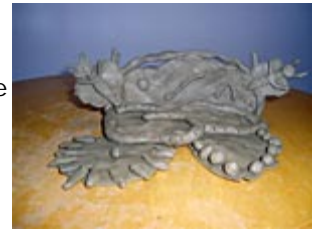
Modelagem em Argila

Ao chegar ao Oeste, a energia se extroverte para que o sujeito possa conectar-se com as possibilidades do universo sensorial. Aqui a qualidade energética da Água conecta-se com a Terra, ganhando densidade, incorporando. Torna-se, então, Argila. Esta é representada miticamente na figura de Céramo , o filho de Dioniso e Ariadnes que nasceu no Hades (BRANDÃO, p. 201).