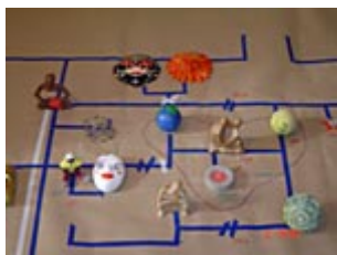
Trabalho com Genograma

As técnicas que envolvem o fogo neste momento possibilitam uma introspecção. É o caso de passar o papel sob a chama da vela, contemplar as manchas e completar a imagem com pastel seco. Ou de derreter o giz de cera na chama da vela, desenhando sob pano ou papel.