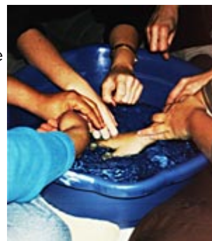
Experimentação com Água em Grupo

O foco do trabalho é o mergulho no inconsciente seja através das imagens, seja pelo movimento, pelo toque ou pela música.