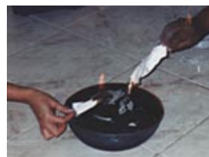
Queima de Cartas

Também os trabalhos de contemplação, onde se sai de um mergulho profundo para reverenciar o Cosmos integra este ponto. Finalmente no Sudeste, o fogo brando da vela revela o poder do fogo transformador. Este não queima nem esfria, mas mantém aquecido, transformando, purgando - destruindo as diferenças, extinguindo os desejos, reduzindo ao estado primeiro da matéria. É o fogo de Héstia.