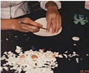
Mosaico com Casca de Ovo

Ao se aproximar do Noroeste, a massa corrida, a massa biscuit, a massa de sabonete, o gesso, a massa de modelar, são materiais que ganham forma e secam rapidamente em contato com o ar.