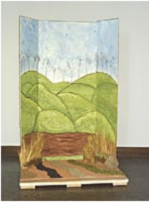
Altar da Terra

Outro trabalho realizado em Arte Terapia é a construção de uma Roda Xamânica, através de altares de cada Ponto Cardeal, utilizando-se dos elementos correspondentes, integrados a outras representações simbólicas referentes a estes. Tal qual para os índios norte americanos, este trabalho edifica uma representação simbólica do Universo e da Mente Universal, uma vez que a Roda é um mapa da mente.