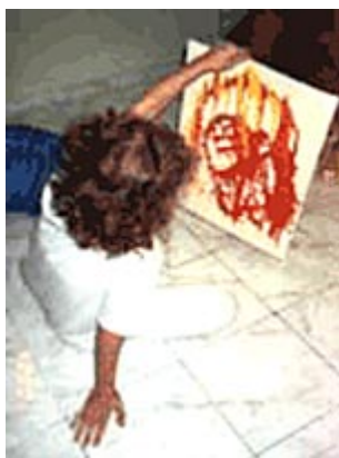
Aguada de Nanquim sobre papel

No trabalho com máscaras, o uso das Máscaras Neutras (13) leva a vivências regressivas. Diante do rosto sem contornos precisos e da visão difusa, os movimentos realizados são, em geral, circulares e "para dentro". O sujeito fecha-se em si mesmo ou coloca-se em posição fetal. Muitas vezes busca-se o apoio do chão, da parede, de almofadas, de bolas grandes. Surgem sensações de leveza, de estar na água, de flutuação.