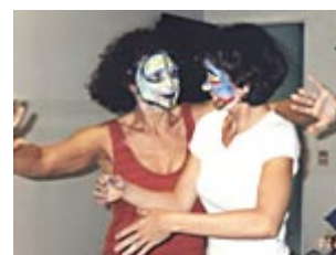
Diálogo Tônico: Máscara de Pintura no Rosto

Aqui se retorna a questão da delimitação. Agora se faz possível perceber que "a própria aceitação de limites - das delimitações que existem em todos os fenômenos, em nós e na matéria a ser configurada por nós - é o que nos propõe o real sentido da liberdade de criar" (21). Trata-se da real aceitação dos limites.