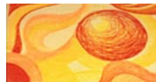
Pastel Óleo sobre papel

Na representação plástica do adulto observa-se que a qualidade do traço se caracteriza pela fluidez das linhas, pelo ondulamento, pelas curvas, pelo movimento espiralado, e pela forma circular. A ligação entre as representações gráficas no espaço se dá pela proximidade e interdependência - superposição (onde o limite e a imagem se fundem, ficando inseparáveis). As linhas sugerem a sensualidade, a emotividade, a instabilidade, a calma.