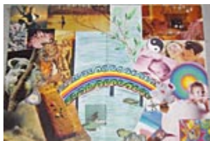
A Ponte: imagens do passado que se quer deixar e do futuro que se deseja construir (Colagem e Pastel Óleo)

As técnicas que trazem imagens do futuro a curto, médio e longo prazo, bem como aquelas que permitem a visualização de novas possibilidades para o momento presente, são adequadas nesta fase.