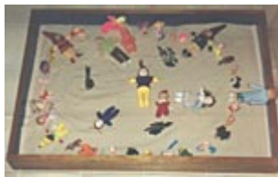
Sandplay: a Caixa de Areia

O uso de diferentes texturas leva a algum tipo de impressão sensorial, podendo trazer lembranças ou a emergência de imagens inconscientes. Tal trabalho acontece na exploração de diferentes superfícies: lisas, ásperas, enrugadas, esponjosas, crespadas, aveludadas, acetinadas, felpudas, granuladas, onduladas etc. - podendo ser realizado tanto corporal como plasticamente.