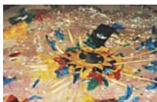
Mandala do Sol: Síntese da construção de diferentes grupos.

Cabe aqui o trabalho de meditação - focalizando elementos da natureza (fogo, água etc.), as cores, as imagens, o movimento. Nestas vive-se um estado de contemplação. A atenção focaliza o mundo interno, permitindo um mergulho profundo em si mesmo. Ao contemplar, não apenas se olha, mas se estabelece uma relação profunda com o objeto contemplado, reconhecendo sua existência independente e fundindo-se a este, ao mesmo tempo.