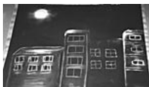
Risco com Agulha em Papel Craft sobre guache preto. Desenho com pastel seco e giz.

Torna-se, então, capaz de utilizar-se dos efeitos de luz, sombra e distância: passa para a fase do Pseudonaturalismo.