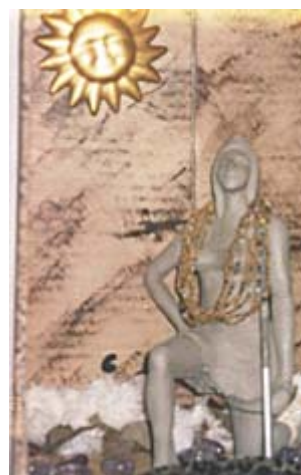
Artemis: Modelagem em Argila

Faz-se importante focalizar o trabalho com o espaço, o que favorece a consciência de si. É no espaço, seja ele concreto (físico) ou simbólico (gráfico), que se fortalece a identidade, possibilitando a autenticidade do sujeito.